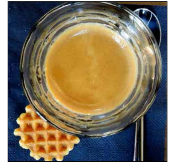
Vista del casco antiguo de la ciudad de Luxemburgo y su catedral. Sobre estas líneas, un típico café, que se puede degustar en más de trescientos locales.

Con una superficie de 2.586 km 2 , que representa la mitad de la comunidad autónoma de La Rioja, el Gran Ducado de Luxemburgo constituye uno de los países más pequeños del mundo. Su extensión le traslada al puesto 179 de los 195 estados que hay actualmente reconocidos.